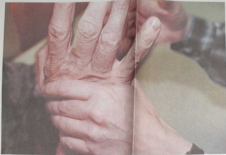
Vierhandengebarentaal: een van de communicatiemiddelen voor een doofblinde.